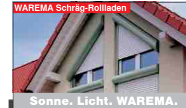
Sonne. Licht. WAREMA.