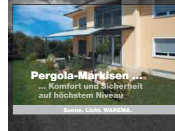
Sonne. Licht. WAREMA.