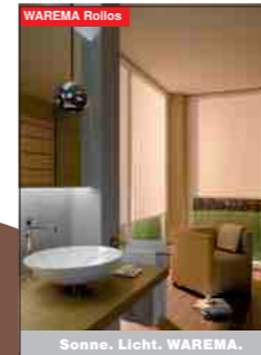
Sonne. Licht. WAREMA.

TISCHLEREI FRINGS Uppersberg 21 51375 Leverkusen Tel. 0214 / 5 62 00 www.tischlerei-frings.de